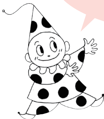
両立支援キャラクター 両立するべえ

より詳しい「就業規則の規定例」をお知りになりたい方は、 厚生労働省ホームページ http://www.mhlw.go.jp/topics/2009/07/tp0701-1.html をご覧ください！