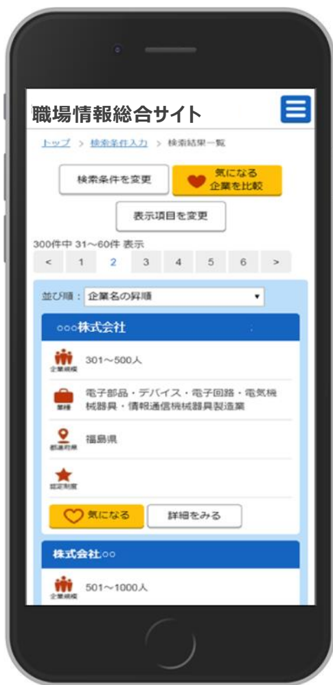
検索結果一覧画面